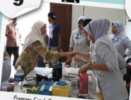
Program Cegah Jenayah & Pemeriksaan Kesihatan