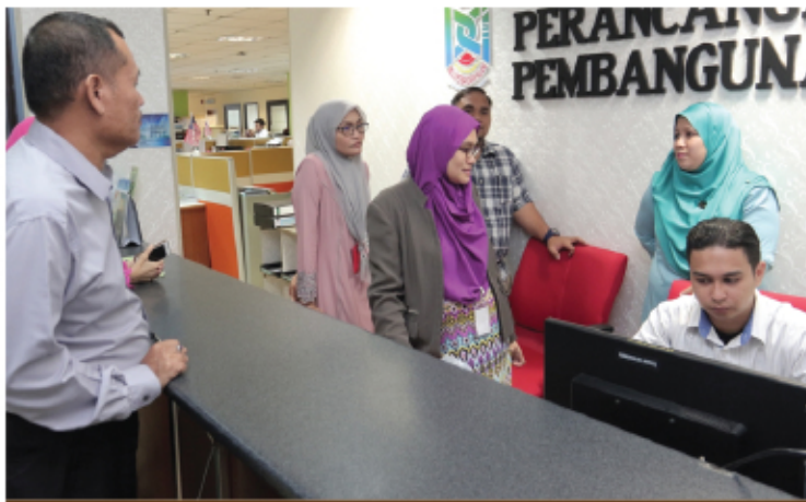
AUDIT ISMS DI MAJLIS PERBANDARAN KAJANG 3 & 4 FEBRUARI 2017 MENARA MPKJ