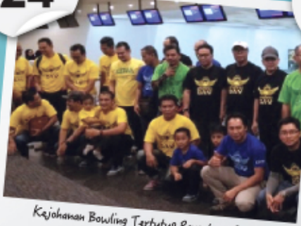
Kajohanan Bowling Tertutup Persatuan Penduduk Taman Impian Putra Fasa 6