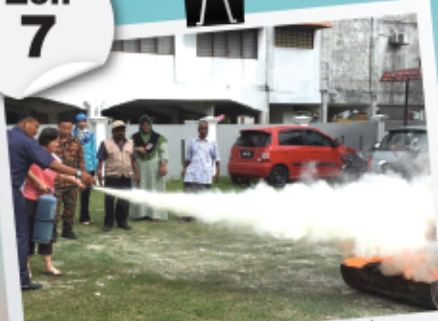
Kempen Keselamatan Kebakaran Negeri Selangor