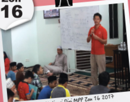
Program Motivasi Diri MPP Zon 16 2017