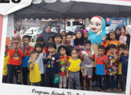
Program Aisyah The Bookworm