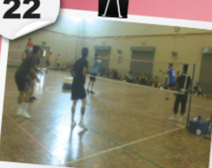
Kejohanan Sepak Takraw Taman Sahabat