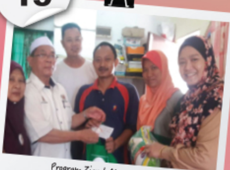
Program Ziarah Mesra Prihatin Dan Taufan Mahabbah