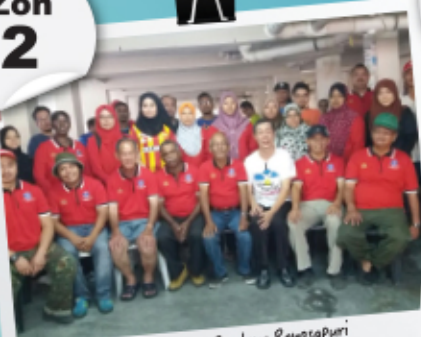
Gotong-Royong Perdana Pangsapuri Taman Segar Perdana