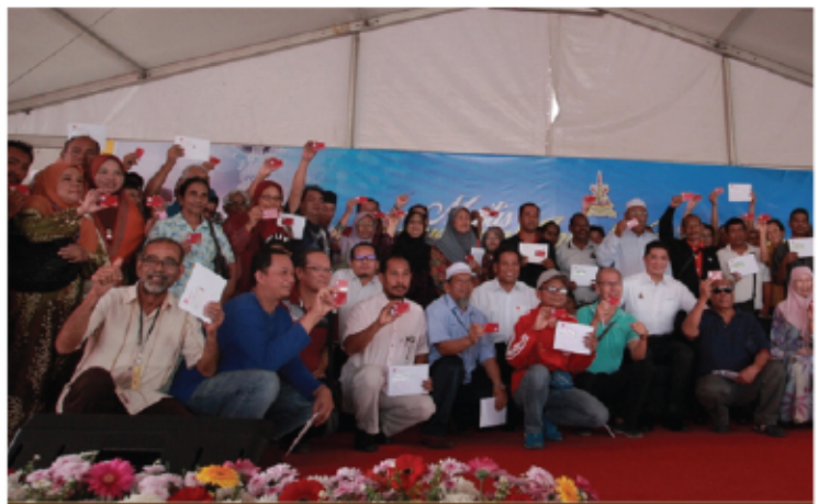
MAJLIS MENYEMARAK INISIATIF PEDULI RAKYAT 28 FEBRUARI 2017 DATARAN STADIUM KAJANG