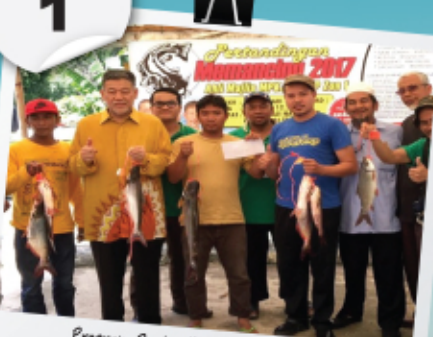
Program Pertandingan Memancing 2017