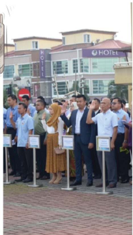
PERHIMPUNAN PAGI MPKJ BULAN MAC 2017 8 MAC 2017 MENARA MPKJ