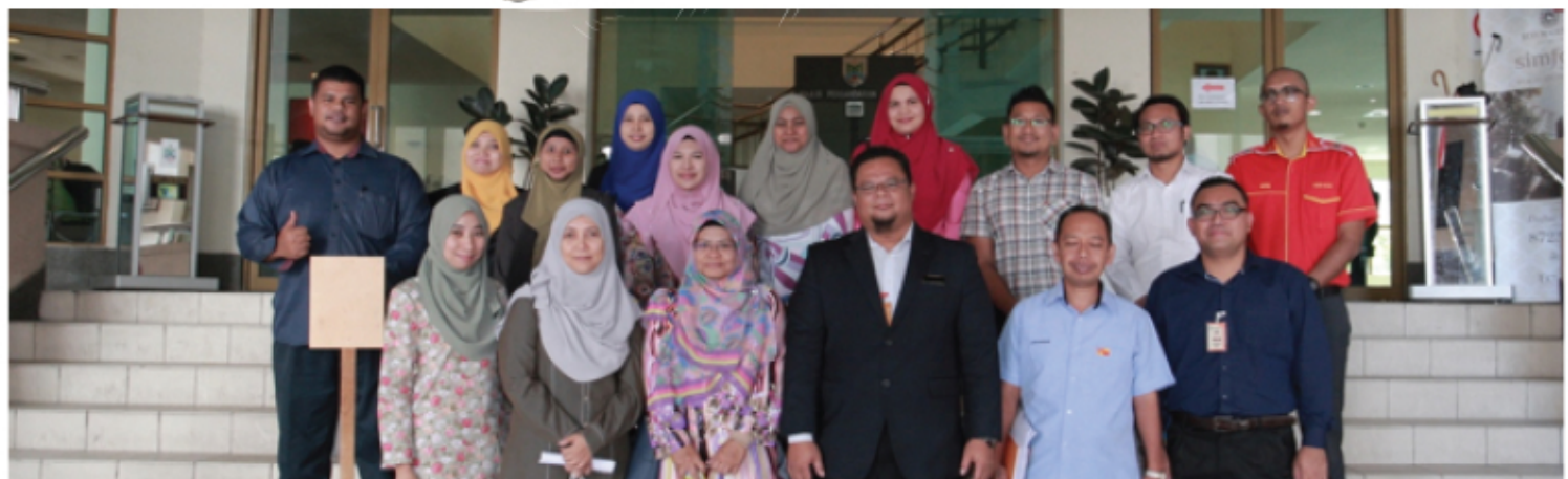
LAWATAN DARIPADA MAJLIS PERBANDARAN SELAYANG 22 MAC 2017 MENARA MPKJ