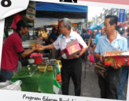
Program Edaran Buah Limau Mandarin