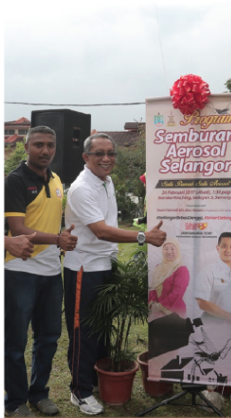
PROGRAM SEMBURAN AEROSOL SELANGOR 26 FEBRUARI 2017 SEKSYEN 5, BANDAR RINCHING SEMENYIH