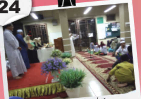
Majlis Anak Kariah Cemerlang