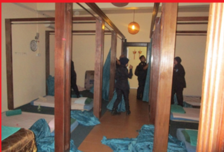
Beberapa barang & kelengkapan seperti langsir yang disita atas beberapa kesalahan.

unit kerusi urut, 74 unit langsir dan 32 unit katil telah disita. Tindakan yang telah diambil adalah berpandukan Undang-Undang Kecil Pusat Kecantikan dan Penjagaan Kesihatan (MPKj) 2007.