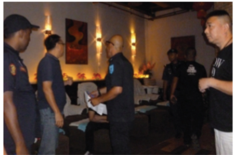
Kelihatan pegawai penguatkuasa dari Majlis Perbandaran Kajang sedang membuat pemeriksaan ke atas premis berkenaan.

Pada operasi tersebut, sebanyak 18 premis rumah urut dan pusat kecantikan telah diperiksa. Hasil operasi juga mendapati premis-premis tersebut tidak mempunyai lesen serta melanggar syarat lesen yang telah dikeluarkan oleh pihak MPKj. Sebanyak 59 unit tilam, 12