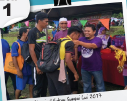
Karnival Sukan Sungai Lui 2017