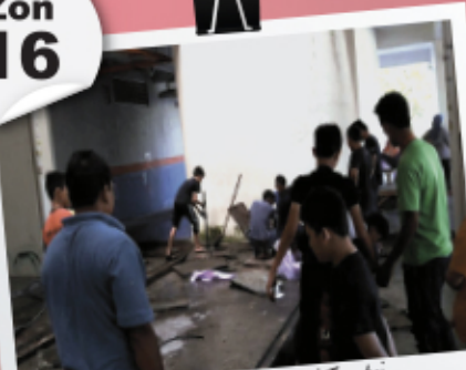
Gotong-Royong Pangsapuri Teratai Bandar Teknologi Kajang