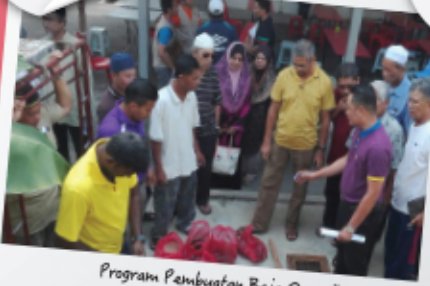
Program Pembuatan Baja Organik