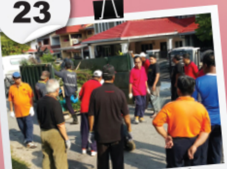
Gotong-royong Penduduk Puspasari Sek 3 Bandar Baru Bangi