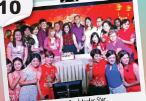
Pesta Ang Pau Wonder Star