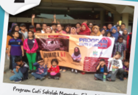
Program Cuti Sekolah Menonton Filem "Adiwiraku"