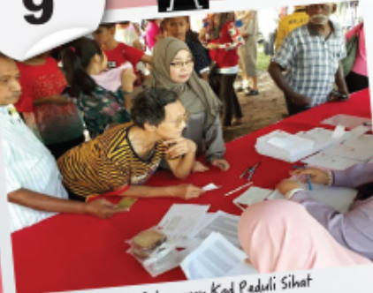
Majlis Pelancaran Kad Peduli Sihat & Peduli Siswa