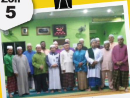
Ceramah Israk Mikraj 15 Mei 2017