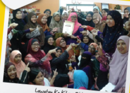
Lawatan Ke Kilang Biskut Rayo 10 Mei 2017