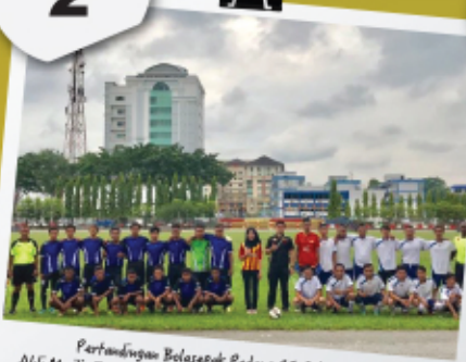
Pertandingan Bolasepak Padang 11 Sebelah Anjuran Ahli Majlis Zon 2 dengan Kerjasama PEBT Zon 2 - 1-2 April 2017