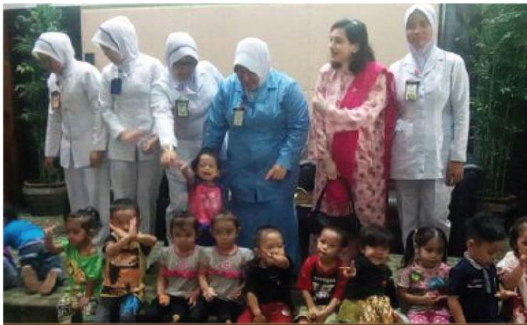
PROGRAM PEMERIKSAAN KESIHATAN KANAK-KANAK TASKA MPKJ 13 APRIL 2017 MINI TEATER, MENARA MPKJ