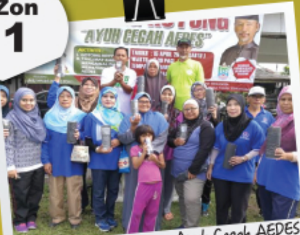
Program Gotong-royong Ayuh Cegah AEDES Taman Titiwangsa - 15. April. 2017