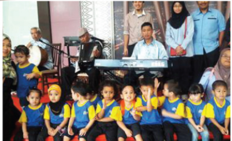
LAWATAN TASKA MPKJ KE MENARA KUALA LUMPUR 25 MEI 2017 DATARAN STADIUM KAJANG