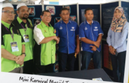
Mini Karnival Masjid Taman Rakah 2017 20 - 21 Mei 2017