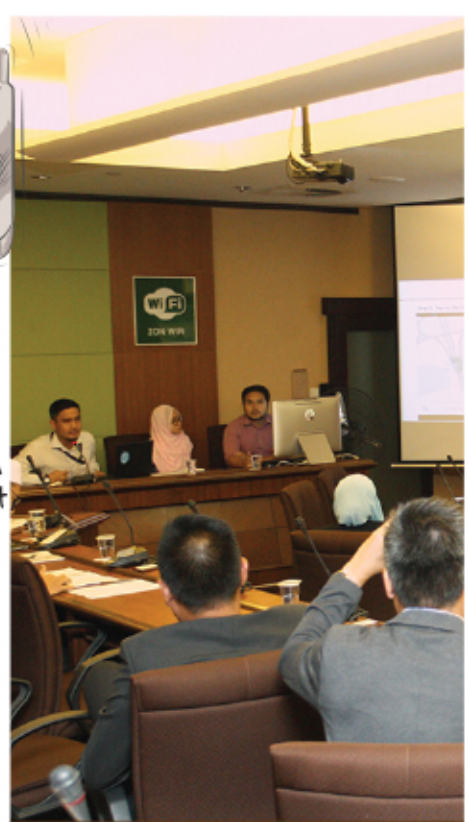
TAKLIMAT ADUAN WAZE 25 APRIL 2017 BILIK MESYUARAT CEMPAKA PUTIH 1, MENARA MPKJ