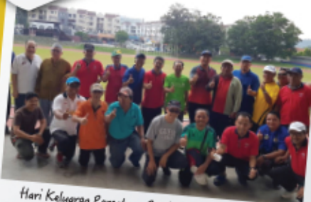
Hari Keluarga Persatuan Penduduk Puspasari Jalan 3/6 14 Mei 2017