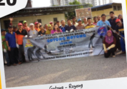
Gotong - Royong 03 April 2017