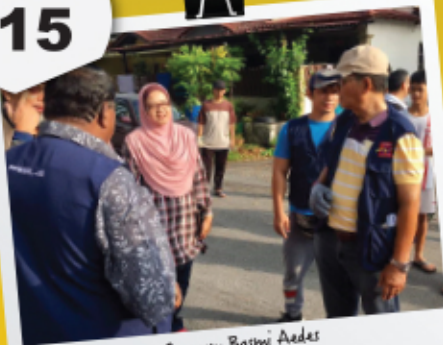
Program Basmi Aedes 21 Mei 2017