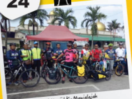
Dari Masjid Ku Menjelajah 16 April - 14 Mei 2017