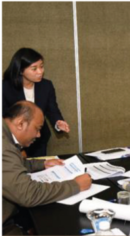
BENKEL PENGURUSAN RISIKO 11 - 13 MEI 2017 BEST WESTERN I-CITY SHAH ALAM