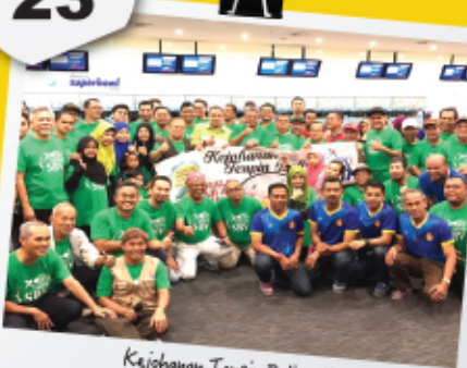
Kajohanan Tenpin Bowling Sbv 2 April 2017