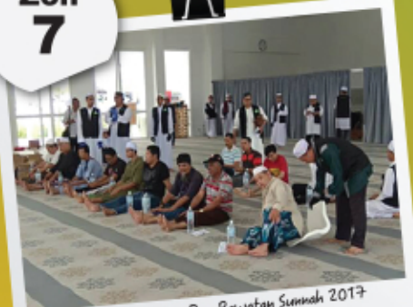
Karnival Kesihatan Dan Rawatan Sunnah 2017 14 Mei 2017