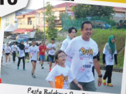
Pesta Balakong Run 2016 23 April 2017