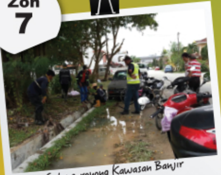
Gotong-royong Kawasan Banjir 22 April 2017