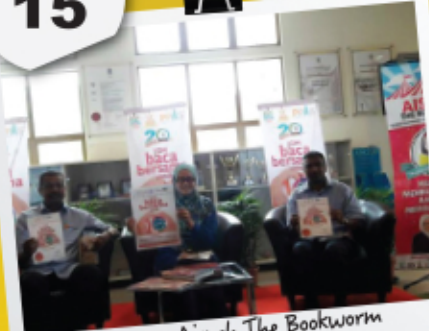
Program Aisyah The Bookworm 25 April 2017