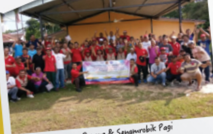
Gotong Royong & Senamrobik Pagi 14 Mei 2017