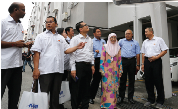
MAJLIS PELANCARAN WIFI SMART SELANGOR DUN KAJANG 24 MEI 2017 TAMAN SEPAKAT INDAH SG. CHUA