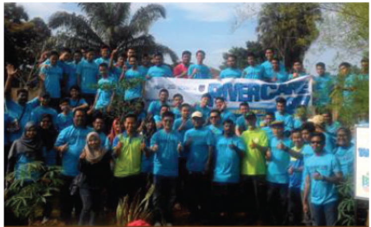
RIVER CARE 2017 15 APRIL 2017 KOLAM AIR PANAS DUSUN TUA