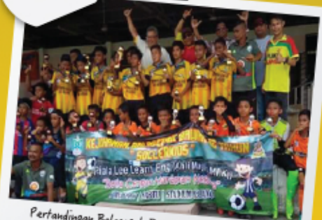
Pertandingan Bolasepak Bawah 12 Tahun (Soccerkids) 6 Mei 2017