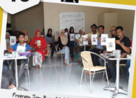
Program Jom Baca 10 Minit Bersama Mpp Zon 16 25 April 2017