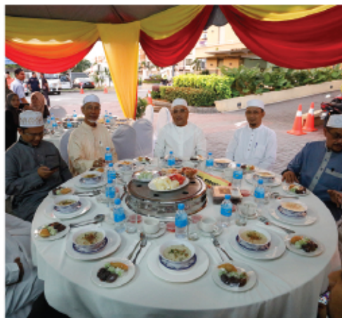
MAJLIS BERBUKA PUASA MPKJ BERSAMA ANAK YATIM 8 JUN 2017 MENARA MPKJ