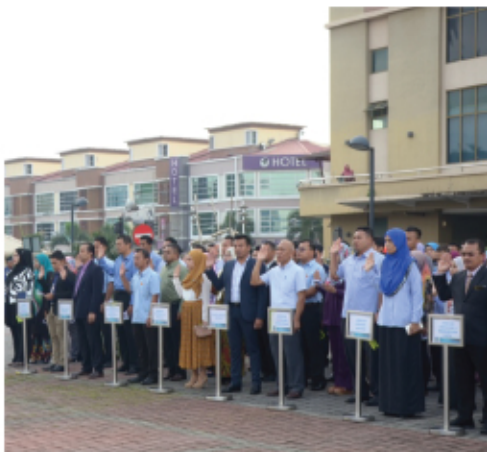
PERHIMPUNAN PAGI MPKJ BULAN JUN 2017 5 JUN 2017 MENARA MPKJ