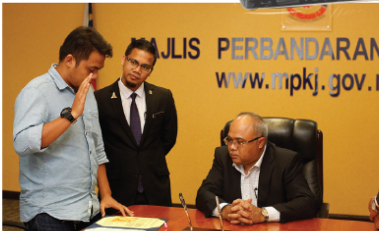
IKRAR INTEGRITI KONTRAKTOR MPKJ 28 JULAI 2017 MENARA MPKJ