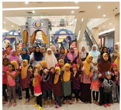
PROGRAM JOM SHOPPING RAYA BERSAMA ANAK YATIM 16 JUN 2017 AEON CHERAS SELATAN SHOPPING CENTRE