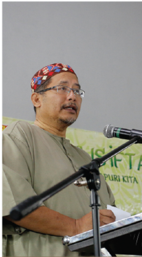
MAJLIS IFTAR KEMPEN PANGSAPURI KITA BERSIH & CERIA 16 JUN 2017 PANGSAPURI SRI KENARI KAJANG