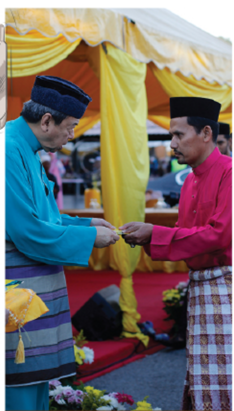
MAJLIS IFTAR BERSAMA DYMM SULTAN SELANGOR 14 JULAI 2017 MASJID BANDAR RINCHING