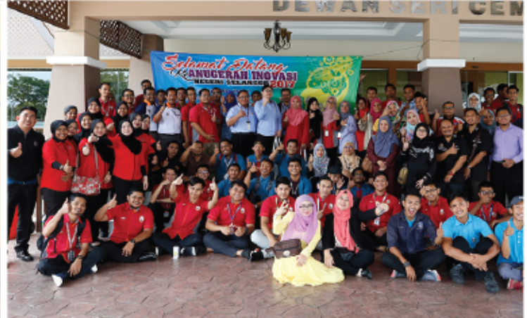
PERTANDINGAN ANUGERAH INOVASI NEGERI SELANGOR 31 JULAI 2017 DEWAN SERI CEMPAKA KAJANG